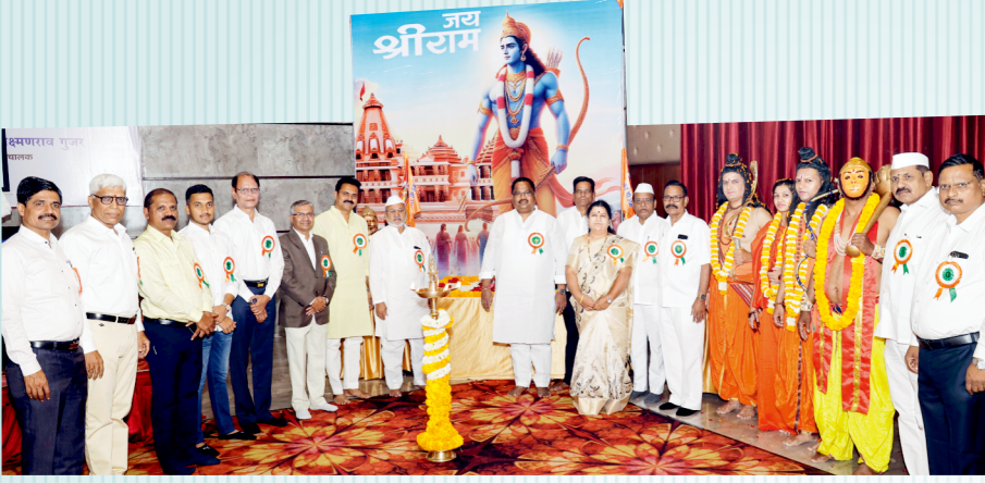
परफॉमन्स अवॉर्ड वर्ष २०२३-२४ मध्ये आपल्या संस्कृतीचे व एकतेचे दर्शन घडविणारा प्रभु श्रीराम स्वागत सोहळा कार्यक्रम सादर करताना बँकेचे सेवक वृंद