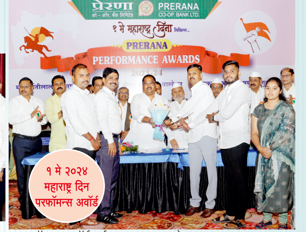
१ मे २०२४ महाराष्ट्र दिन परफॉमन्स अवॉर्ड